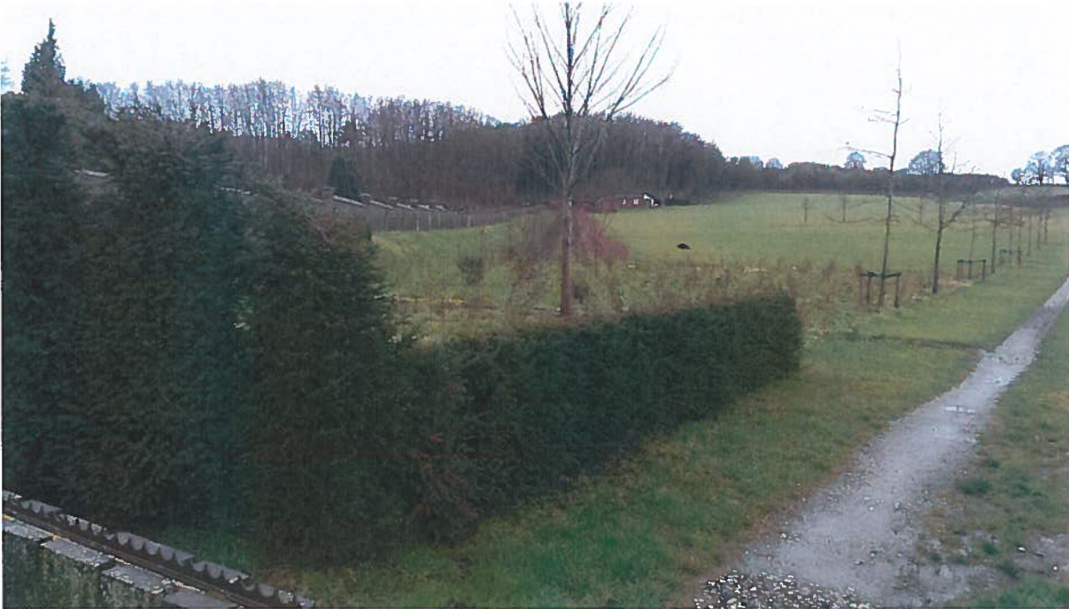
Afbeelding 1: Aanplant van venijnbomen rond de 'entree' van het perceel. Ook is de aanleg van bosplantsoen (links), de aarden omwalling links en de aanplant van bomen langs het 'karrenspoor' goed te zien.