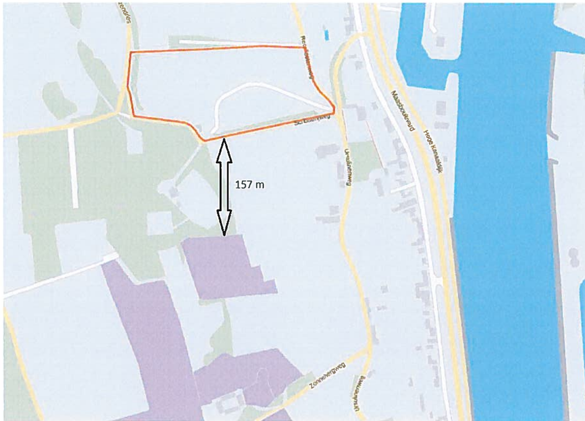
Afbeelding 1: Ligging van glanshaverhooilanden (paars) op minder dan 160 van het plangebied (oranje).