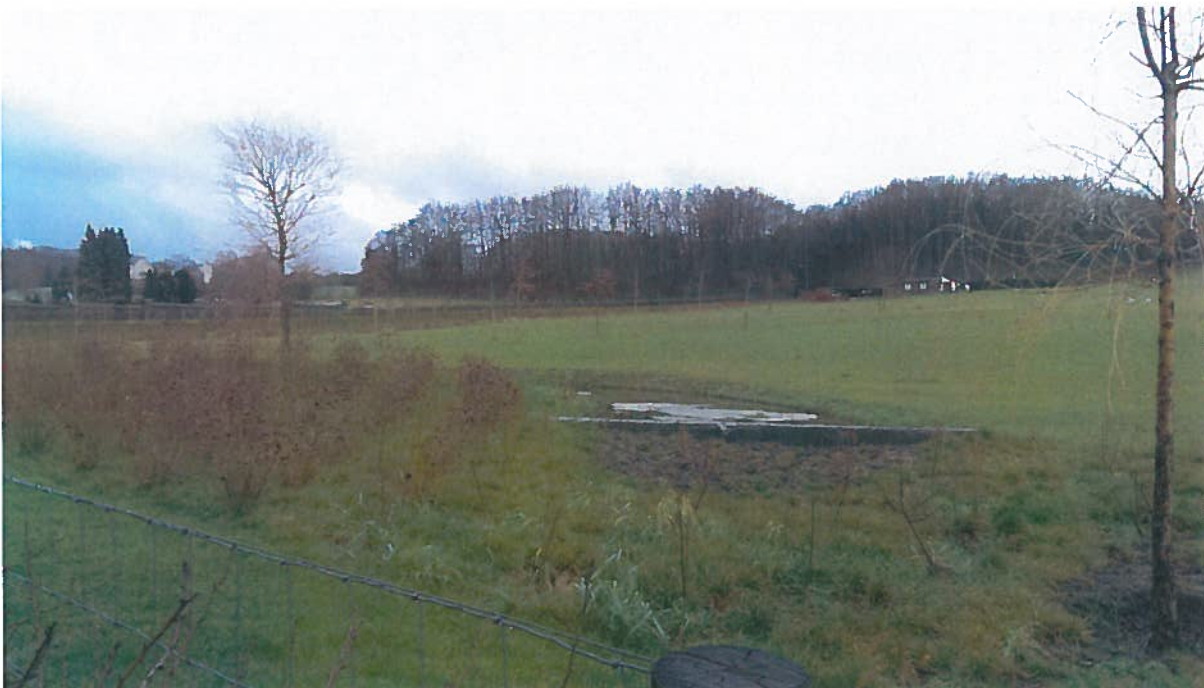
Afbeelding 2: Aangelegde vijver en bosplantsoen.