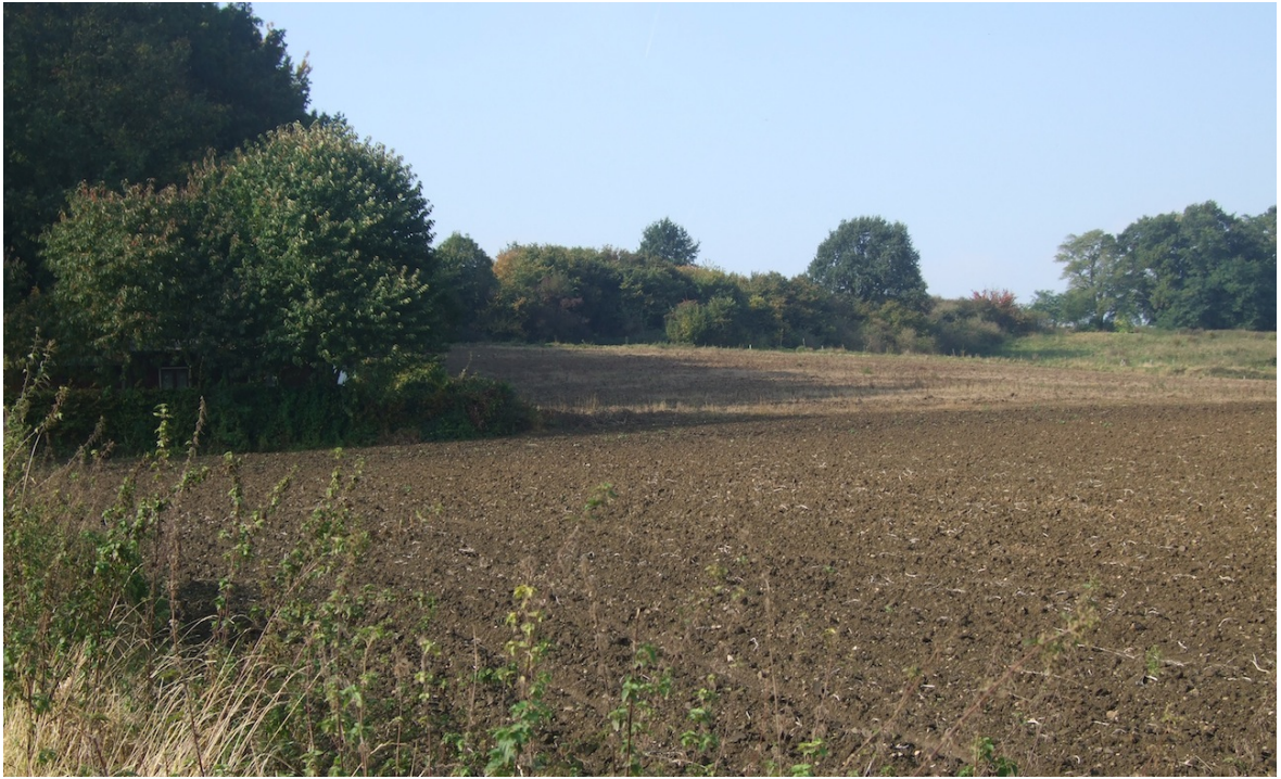
Afbeelding 10: Impressie oorspronkelijke akker. Situatie voor 2011.