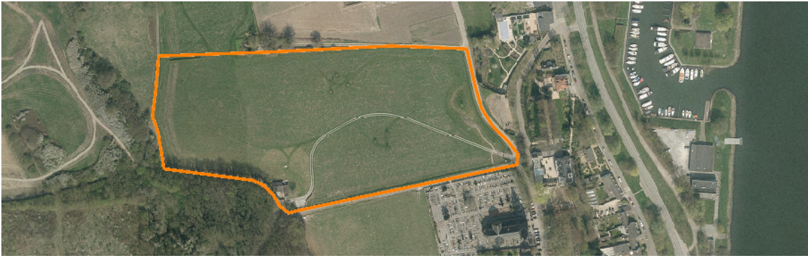
Afbeelding 6: Landgebruik in het plangebied in 2013. © GISViewer Limburg 2015.