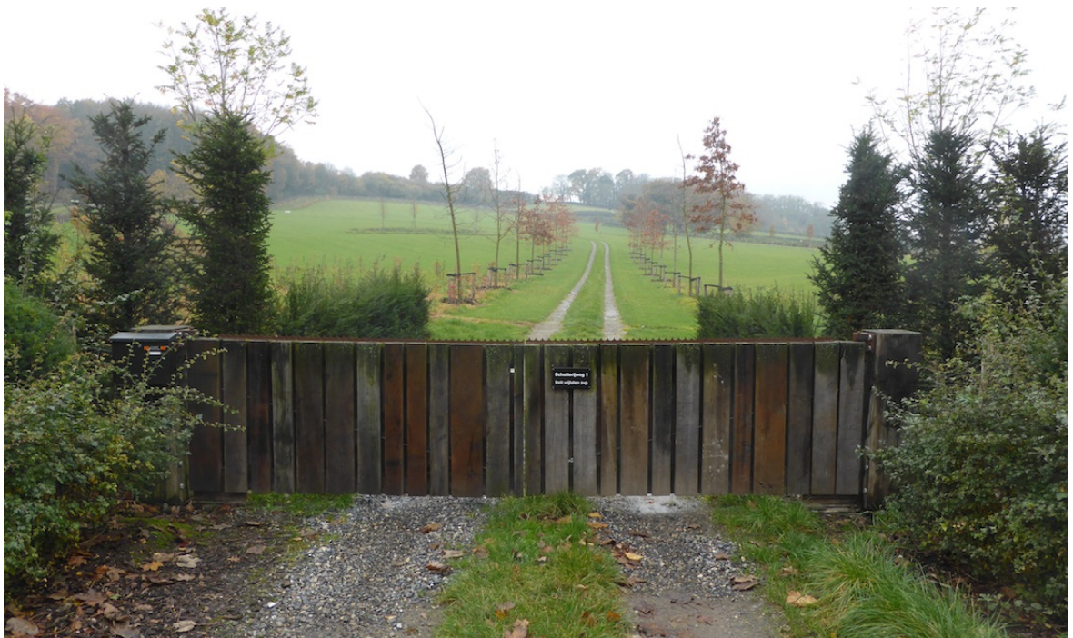
Afbeelding 11: Impressie situatie anno 2015.