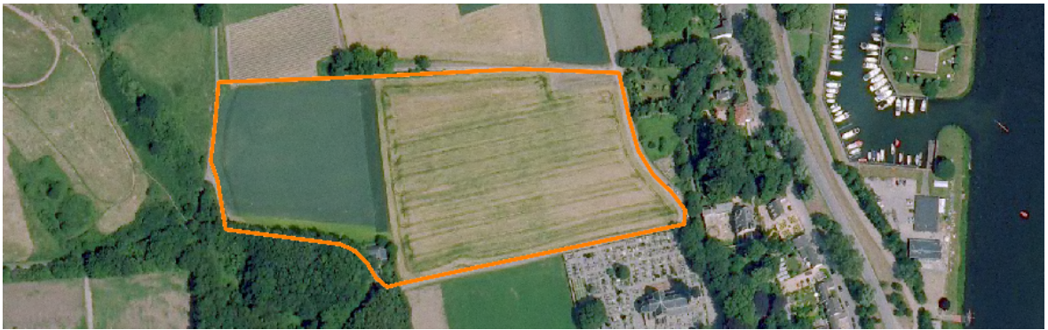
Afbeelding 2: Landgebruik in het plangebied in 2006.