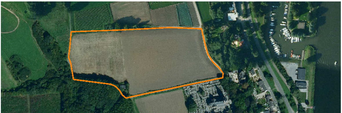
Afbeelding 3: Landgebruik in het plangebied in 2008.