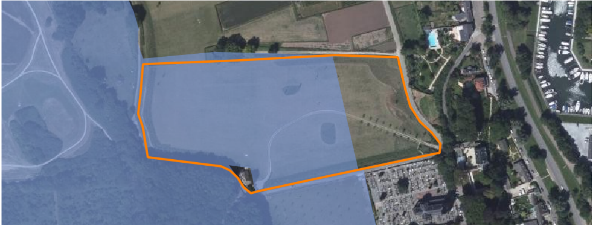
Afbeelding 7: Ligging van Natura 2000-gebied Sint Pietersberg & Jekerdal is met blauw weergegeven.

Beschermde Natuurmonument is aangewezen gelden, voor zover deze niet conflicteren met de kernopgaven en instandhoudingsdoelstellingen waarvoor het Natura 2000-gebied Sint Pietersberg & Jekerdal is aangewezen.