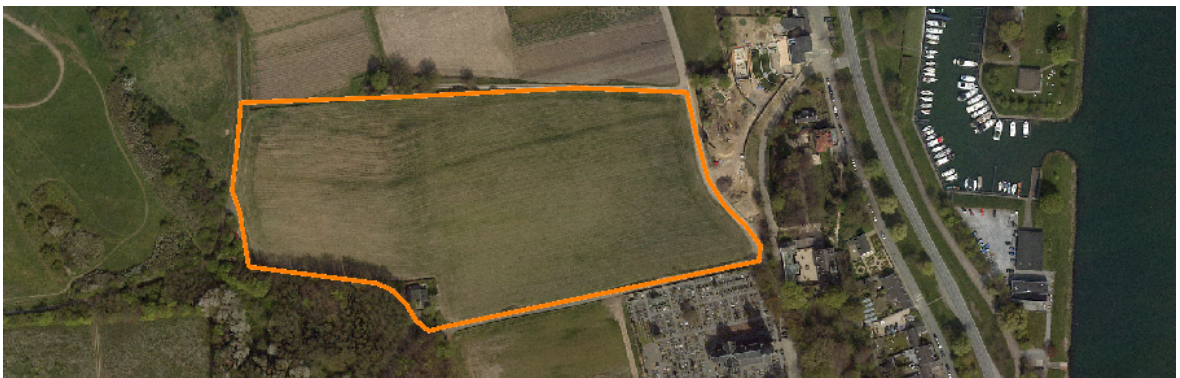
Afbeelding 4: Landgebruik in het plangebied in 2010.