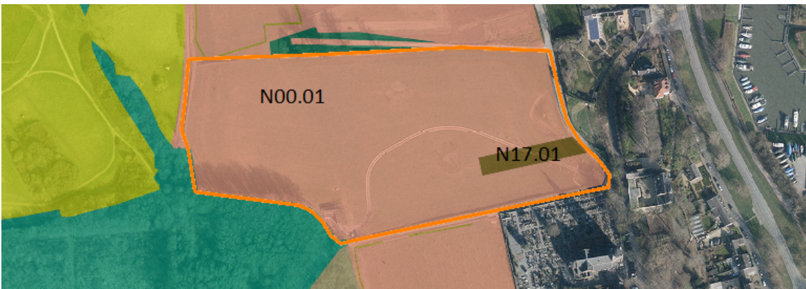
Afbeelding 9: Indeling van het plangebied in beheertypen volgens het Natuurbeheerplan 2016. N00.01 Nog om te vormen naar natuur. N17.01 Vochtig hakhout en middenbos.

Vochtig hakhout en middenbos (Afbeelding 9).