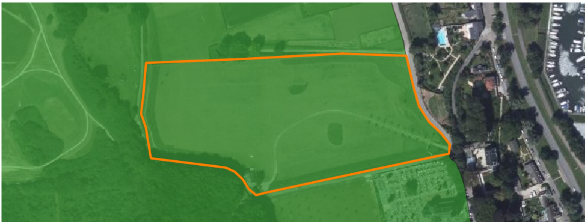
Afbeelding 8: Ligging van Natuurnetwerk is met groen weergegeven.

Het plangebied maakt in zijn geheel deel uit van Natuurnetwerk Nederland (Afbeelding 8). Voor plannen binnen de Natuurnetwerk Nederland, geldt het 'Nee, tenzij principe'. Ingrepen worden niet toegestaan tenzij uitgesloten is dat de ingreep een negatief effect heeft op Natuurnetwerk Nederland.