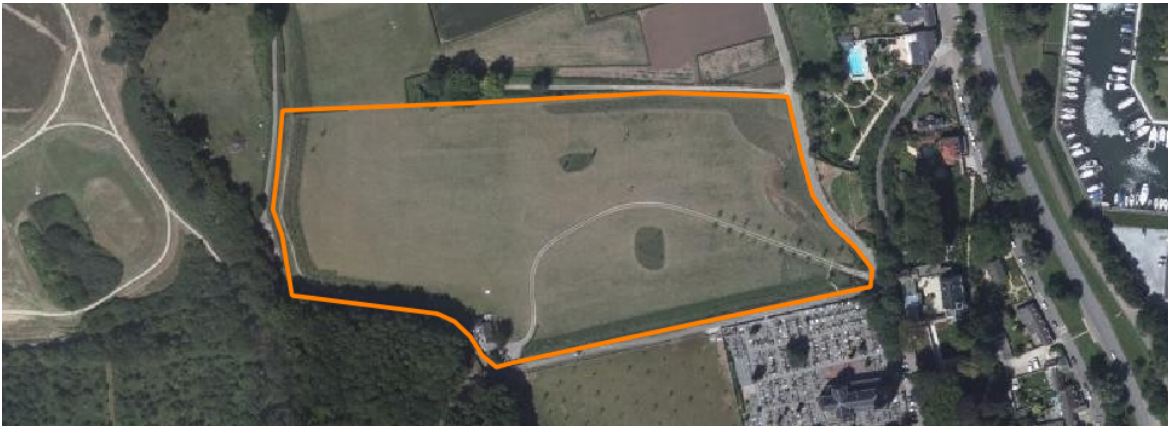
Afbeelding 1: Ligging van het plangebied met de begrenzing in oranje weergegeven. Datum luchtfoto medio 2014 © CC-BY-NC.

Het plangebied is gelegen aan de Schutterrijweg te Maastricht. In Afbeelding 1 is de begrenzing van het plangebied in oranje weergegeven. Op Afbeelding 1 is het karrenspoor duidelijk te zien. Ook is te zien dat er in het oosten van het plangebied bomen langs het karrenspoor zijn aangeplant en dat het perceel deels omwald is. De aangeplante bomen betreffen Amerikaanse eiken ( Quercus rubra ).